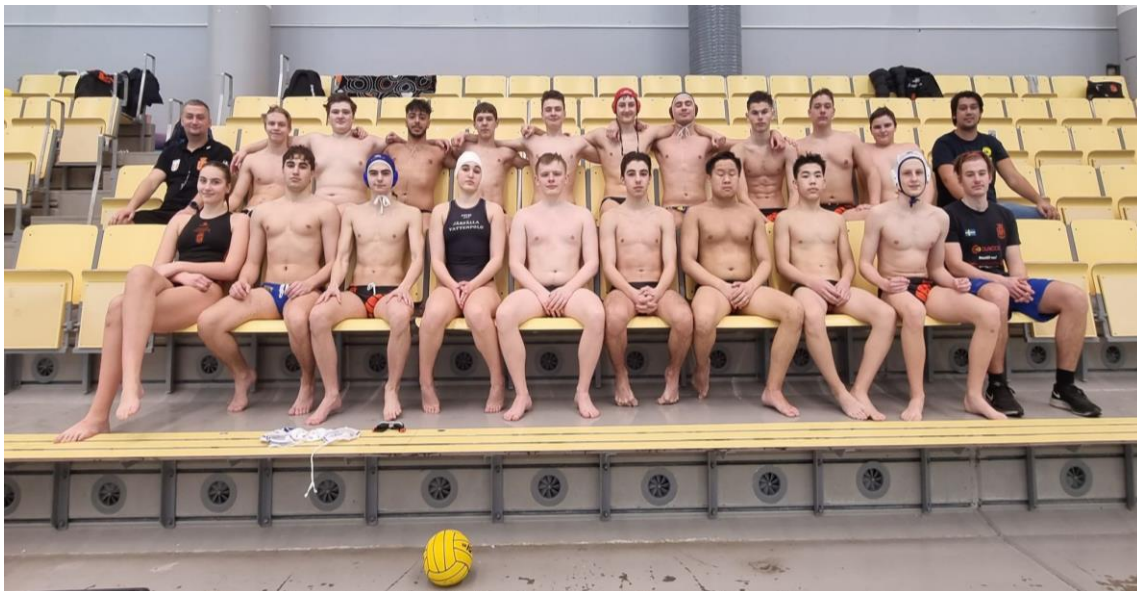
U15 och U17 Stadslagen