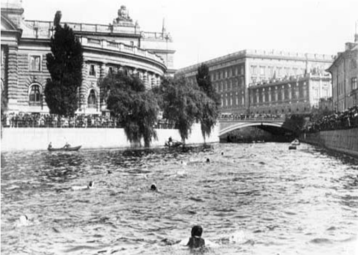
Vy från 20-talets publikfest Strömsimningen i Stockholm.